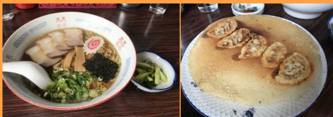
ほたるラーメン 450円 羽ぎょうざ 300円

長野市石渡にある「居酒屋ほたる」をご 紹介します。 居酒屋ですが、さっぱりとしたラーメンが おすすめです。昔ながらの中華そばで、 値段も安く、とてもおいしいです！ 焼き鳥も絶品！ ラーメンは、お昼の時間でも営業してい ますので、是非一度ご賞味下さい。