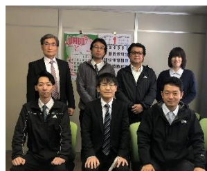
システム営業部 長野 スタッフ 7名