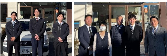
技術スタッフ 3人 / 営業スタッフ 4人、事務1名

謹んで年頭のご挨拶を申し上げます。 昨年中は、格別のお引き立てを賜り、厚く御礼申し上げます。 本年も皆様のお役に立てるよう、また、ご期待に沿えるよう、精一杯努めて参ります。 本年も変わらぬご愛顧の程、お願い申し上げます。