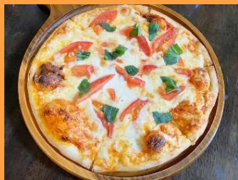
Taverna LAPUTA 安曇野市穂高有明 7039-2